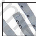
Coupe fibres 6 mm Niveau de sécurité DIN 2 Documents internes.